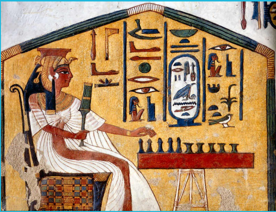
Nefertari ( épouse de Ramsès II ) jouant au Senet