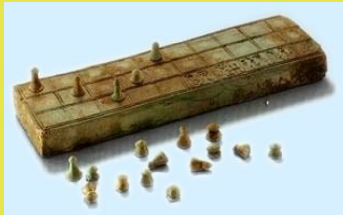
Jeu de Senet retrouvé dans une tombe égyptienne